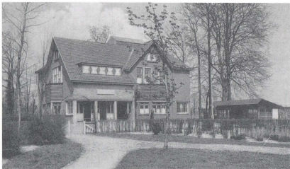
Het Van Hasselt paviljoen, na de vergroting in 1926.

mecapaciteit met zes plaatsen worden vergroot door een inwendige verbouwing, vooral op de zolders. Aangezien de capaciteit ook daarna te klein bleef werd het gebouw vergroot naar ontwerp van architect E. Verschuyl te Hilversum.