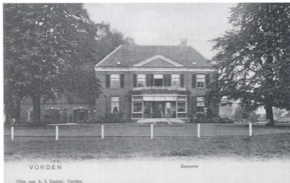
De Decanije, oorspronkelijke staat.