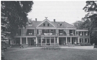
De Decanije, na de vergroting in 1922.

Hij is op deze gedachte gekomen na een gesprek met een collega, die met zijn gezondheid sukkelde, versterkende middelen nodig had en veel in de buitenlucht moest zijn. Het eerste kreeg hij in onvoldoende mate, onder andere omdat hij zijn kinderen in die middelen liet delen en als hij in het Oosterpark (Amsterdam) wandelde, genoot hij van stinkende sloten en de lakfabriek, waarna hij al hoestend naar huis ging: trappen op, 3-hoog. Zo'n man moest nu naar een herstellingsoord kunnen. Verder denkend kwam hij tot het plan ook een invalidenoord te stichten en tot slot zou er ook een mogelijkheid moeten zijn om enige dagen vakantie in de vrije natuur door te brengen.