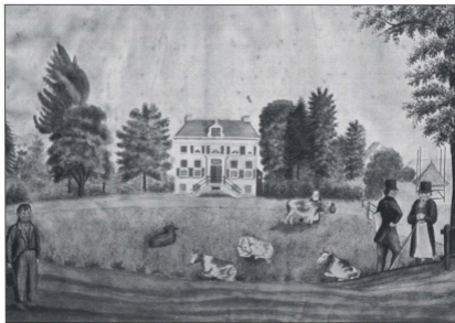
Huize Vierakker. Aquarel gemaakt in het midden van de Negentiende Eeuw. Schilder onbekend.