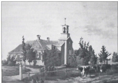
Hervormde kerk Wichmond 1861, door J.J. Zuidema Broos, kunstenaar uit Vorden.

Ongeveer op de helft van de vorige eeuw, in 1855, bouwden de hervormden van Vierakker/Wichmond in de Dorpsstraat hun kerk.