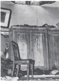
Zo zag de overloop eruit na de brand.