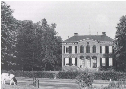
De Wientjesvoort in 1967.

In de avond van de twaalfde december 1968 werd de buitenplaats „Wientjesvoort”, gelegen aan de weg van Vorden naar Ruurlo, door brand geteisterd. Het vuur vernielde het dak en een groot deel van de bovenverdieping, terwijl de rest van het huis zware waterschade opliep. Door deze ramp, naar alle waarschijnlijkheid veroorzaakt door een lekkende schoorsteen, staat het voortbestaan van dit statige huis, behorende tot de thans zo bedreigde groep grote landhuizen uit de negentiende eeuw, op het spel.