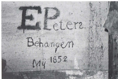
Een herinnering aan de behanger.

Aan de overzijde van de weg werd in opdracht van de freules een nieuw landhuis gebouwd, blijkens een steen in de achtergevel met hun initialen en het jaartal 1850. Twee jaar later zal dit huis voltooid geweest zijn want in één der kamers werd achter de wandbespanning het opschrift „E. Peters/Behangen/My 1852” aangetroffen.